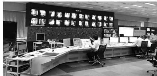
福岡市交通局運行管理システムの更新 (運輸指令所)