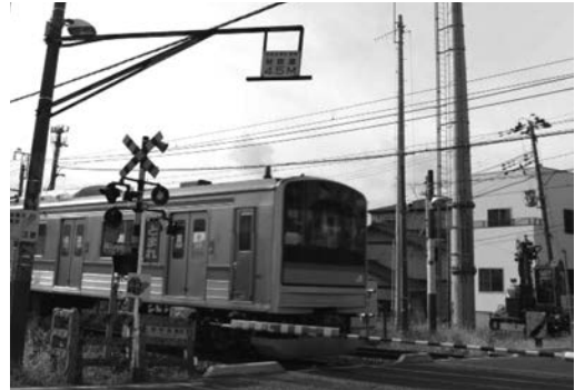
JR東日本ATACSの踏切制御機能使用開始

らくがき帳 ..... 58 国境ブギウギ〜インドシナ奥の細道・前編〜 JREA正会員 藤田崇義